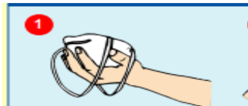
۱- دست را از میان بندهای ماسک عبور داده و ماسک را به صورت کاسه در دست نگه دارید.