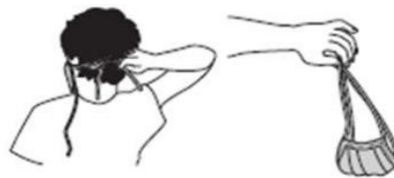
تصویر ۳- نحوه درآوردن ماسک

پس از آن دست‌هایتان را یکبار دیگر بشوید. با اینکار مطمئن می‌شوید که بعد از برداشتن ماسک، هیچ آلودگی بر دستان شما باقی نماند.