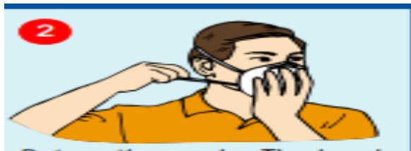
۲- بندهای پشت سروگردن را ببندید.