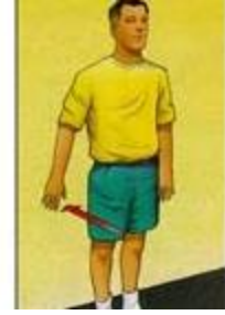
۳- کشش شانه

پشت به دیوار بایستید. دست صاف رو به پایین باشد. آرنج نباید خم شود. بازوی خود را به سمت دیوار فشار بیاورید. ۵ ثانیه استراحت کرده و دوباره این حرکت را ادامه دهید. ۱۰ بار تکرار کنید .