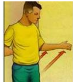
۱- چرخش سرشانه (قسمت خارجی)

موازی دیوار بایستید. آرنج دست تان دارای زاویه ۹۰ درجه باشد. قسمت بیرونی ساعد روی دیوار باشد. به مدت ۵ ثانیه، به دیوار فشار وارد آورید (بدون آنکه شانه حرکت کند) و سپس رها کنید. ۱۰ بار تکرار کنید.