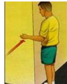
۲- چرخش شانه (قسمت داخلی)

موازی دیوار بایستید. آرنج دست تان دارای زاویه ۹۰ درجه باشد. قسمت بیرونی ساعد روی دیوار باشد. به مدت ۵ ثانیه، به دیوار فشار وارد آورید (بدون آنکه شانه حرکت کند) و سپس رها کنید. ۱۰ بار تکرار کنید.