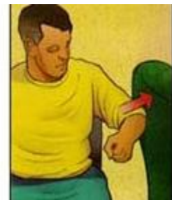
۵- دوری شانه

مطابق تصویر با آرنج خود به یک بالش کوچک فشار بیاورید. ۵ ثانیه در این حالت بمانید. این کار را ۱۰ بار تکرار کنید. روزی سه جلسه این ورزش را انجام دهید.