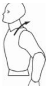
کشش گردن و پشت

چرخش شانه باعث رفع فشار از عضلات شانه و آرامش آن ها می گردد. به جلو خم شوید و یکی از دست های خود را آویزان کنید. به طور فرضی، یک دایره با دست تان بکشید. با دست دیگر خود، میز یا صندلی را بگیرید .