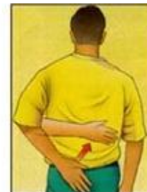
-۶چرخش شانه (قسمت داخلی)

به پهلو خود بخوابید. آرنج دستی که در روی زمین قرار دارد، باید زاویه ۹۰ درجه داشته باشد. یک وزنه سبک در این دست تان بگیرید و آن را به طرف سینه ببرید و آرام برگردانید. ۱۰ بار تکرار کنید. سپس بر روی پهلو دیگر خود بخوابید و این ورزش را تکرار کنید. روزی سه جلسه این ورزش را انجام دهید.