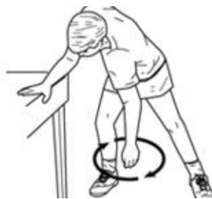
ورزش ساده شانه

چرخش شانه باعث رفع فشار از عضلات شانه و آرامش آن ها می گردد. به جلو خم شوید و یکی از دست های خود را آویزان کنید. به طور فرضی، یک دایره با دست تان بکشید. با دست دیگر خود، میز یا صندلی را بگیرید .