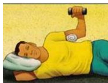
-۷چرخش شانه (قسمت خارجی)

دست خود را پشت تان قرار دهید و بالا و پایین ببرید. ۱۰ بار این ورزش را انجام دهید. روزی سه جلسه این ورزش را انجام دهید.